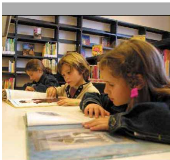
PICCOLI LETTORI Al via l'ottava edizione di "Libro che gira, libro che leggi"